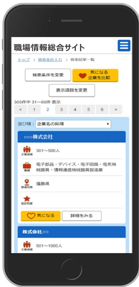
検索結果一覧画面